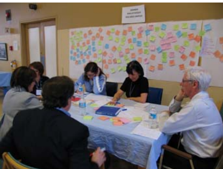
Les gestionnaires ont participé à des ateliers sur la performance, le 1er février dernier. Voici quelques images...

Les termes qualité et performance ne sont souvent pas appariés dans un même projet, l'un étant parfois perçu comme l'opposé de l'autre. Le projet FAIRE ÉQUIPE propose pourtant d'introduire dans notre culture organisationnelle les deux concepts en