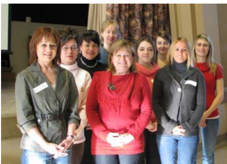
Journée d'accueil des nouveaux employés du 22 février 2011. Bienvenues parmi nous!