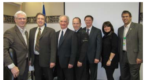
Le 2 février, des gens du Centre hospitalier universitaire de Sherbrooke sont venus faire une présentation portant entre autres sur leurs projets d'optimisation.

À vous de réagir! Suivez la discussion sur la page Facebook du CSSS de Trois-Rivières.